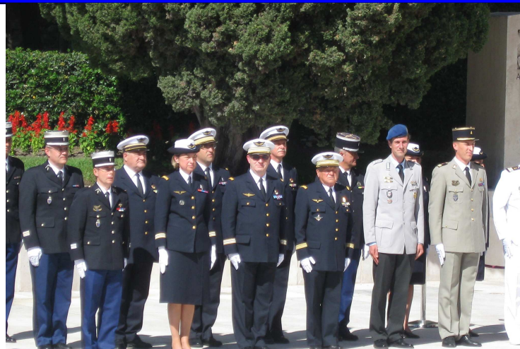
Prise de fonction de Mr le Préfet DREVET lundi 16 mai 2011