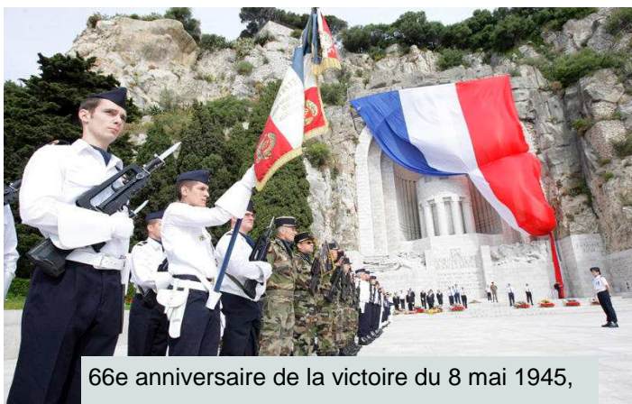
66e anniversaire de la victoire du 8 mai 1945,